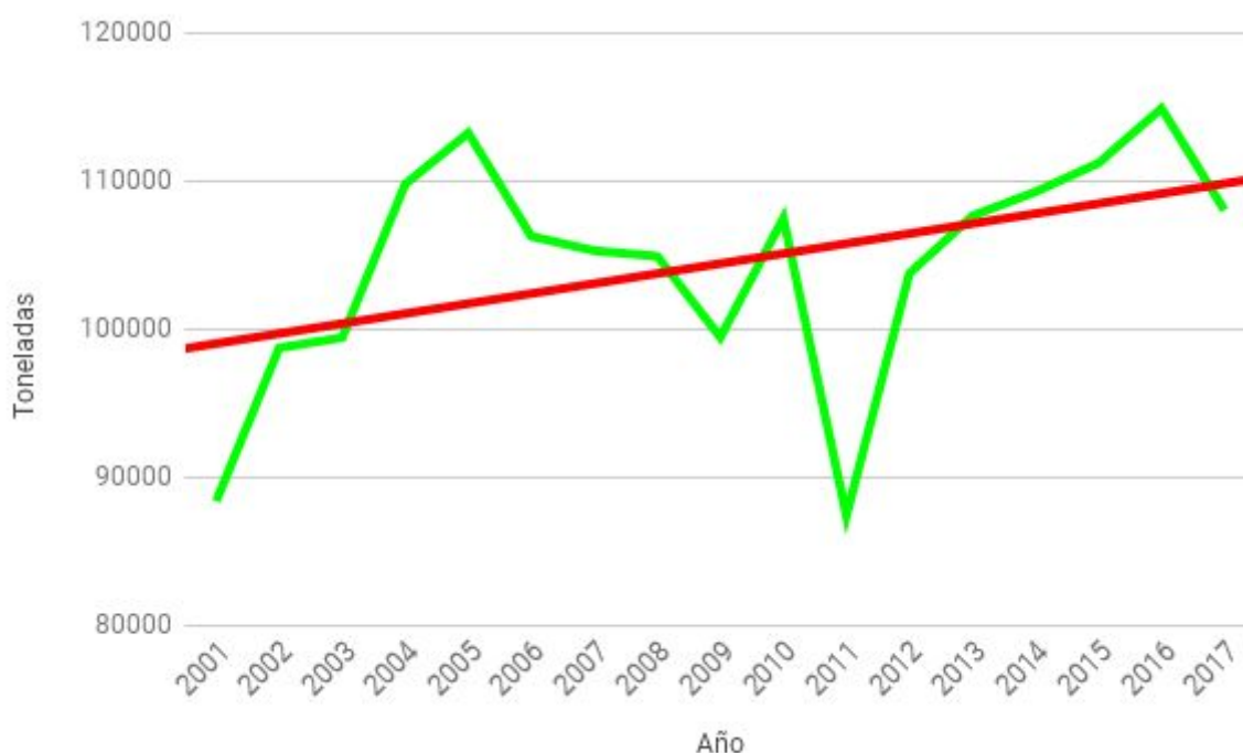
Gráfico N° 1: Evolución histórica de la oferta de cebolla al MCBA, medido en toneladas, período 2001-2017 con su línea de tendencia.

Fuente : Elaboración propia con datos suministrados por el Departamento Información, CMCBA.