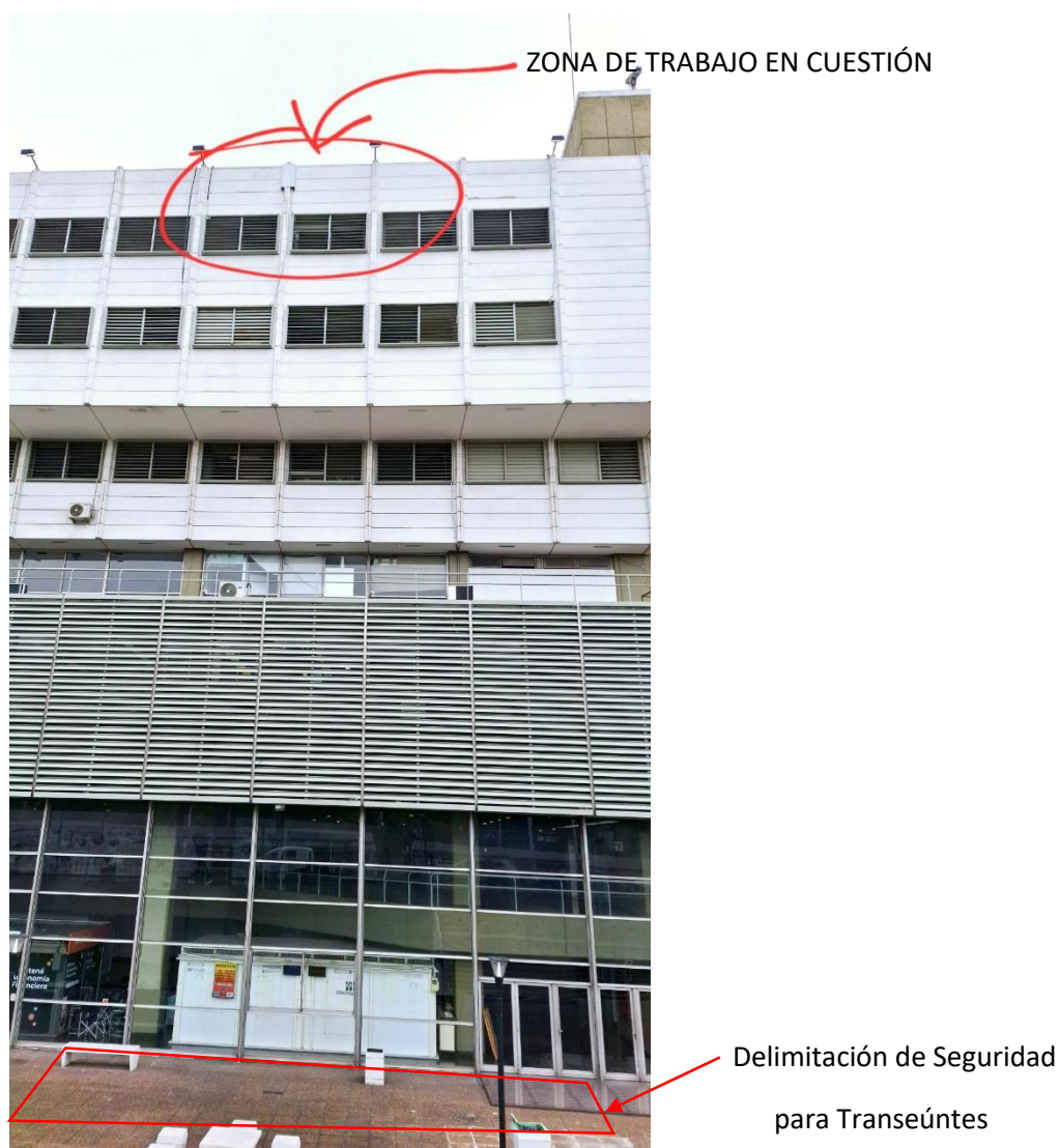
Vista Frontal Fachada Edificio Centro Administrativo