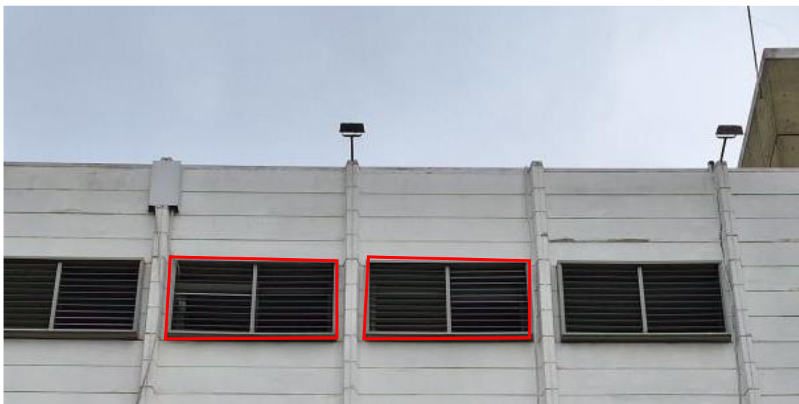
Vista Frontal Exterior - 5to. Piso – Edificio Centro Administrativo (Lo rojo indica lo que hay que sellar)

Impermeabilización: Aplicación de sellador elástico pintable para exteriores adecuado para uso en mampostería en todo el surco del encuentro alrededor de toda la línea del perímetro en ambas ventanas a tratar. Ver foto a continuación de la zona a tratar.