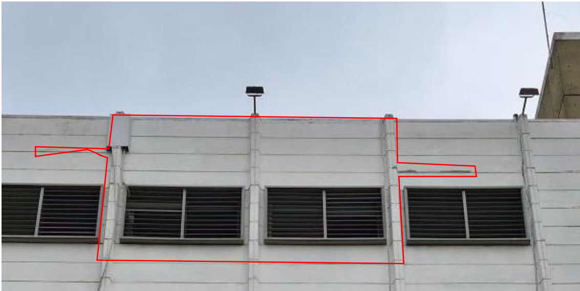
Zona a Tratar

Impermeabilización: Aplicación de pintura tipo recuplast frente impermeabilizante elástico color blanco en toda la superficie tratada del murete. Aplicar mínimo dos manos del producto y/o como indica el fabricante, bajo la estética de las reglas del buen arte para tales fines.