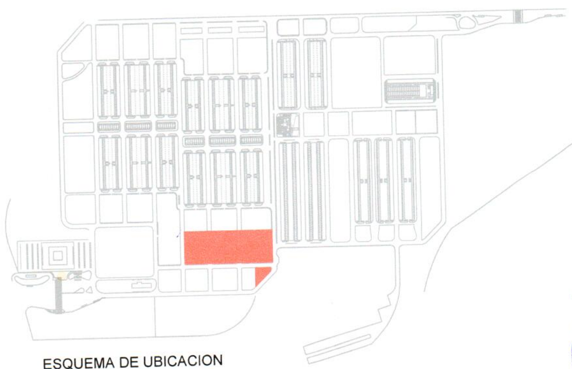
ESQUEMA DE UBICACION

[Handwritten signature] Sección Obras 1623